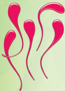
8 條黏黏舌 (含2個備用)