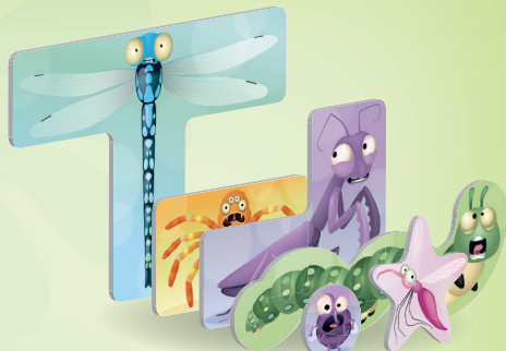
30 個昆蟲指示物 (6種昆蟲 × 5 種不同顏色)